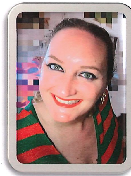
REINA DE FIESTAS